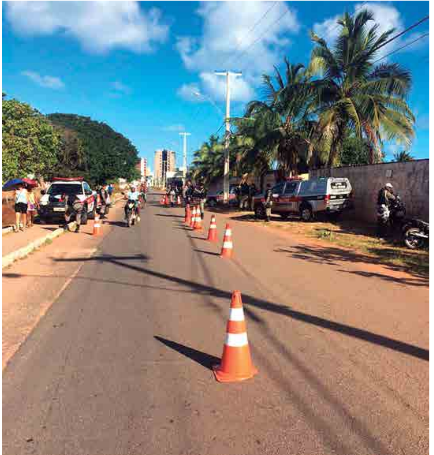
As abordagens deverão apreender armas de fogo, drogas, além de prender suspeitos em situação de flagrante ou cumprimentos de mandados de prisão

As armas e todo material apreendidos foram encaminhados para a Central de Polícia, no bairro do Geisel.