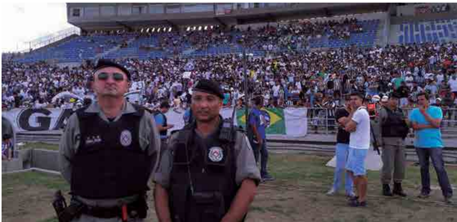
Polícia Militar terá efetivo de mais de 200 policiais para garantir a segurança dos torcedores que comparecerem ao Amigão. Torcida do Belo estará impedida de se aproximar do estádio