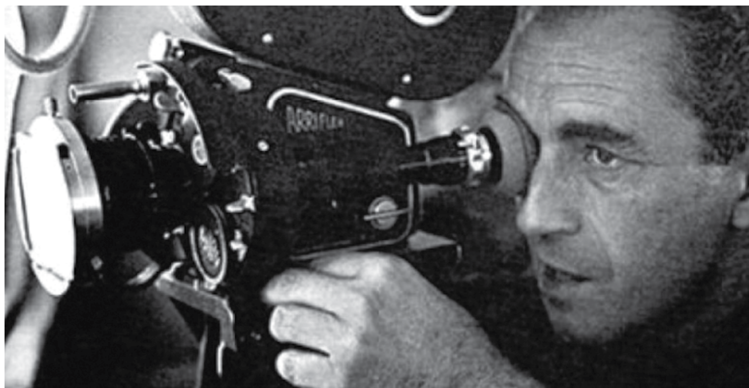
O cineasta e roteirista italiano Valerio Zurlini, falecido em outubro de 1982, realizou o seu primeiro longa-metragem em 1961, intitulado A Moça da Valise

Produção conjunta da Alemanha Ocidental, Itália, França e Irã, o longa - que, em 1977, recebeu o Prêmio David di Donatello, conferido pela Academia Italiana de Cinema e considerado o Oscar do país, nas categorias de Melhor Filme, Melhor Diretor e Prêmio Carreira, concedido ao ator Giuliano Gemma, que integra o elenco - é ambientado no meio do deserto, dentro de um forte, onde um grupo de soldados e oficiais espera por um inimigo que tarda em chegar. Enquanto o tempo passa, todos sobrevivem de forma honrada, tentando respeitar as regras. No entanto, os dias, os meses e