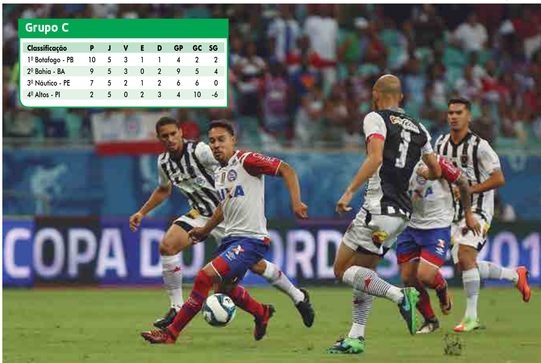
Botafogo-PB defende, hoje no Almeidão, liderança do Grupo C e a permanência na Copa do Nordeste no duelo com o Tricolor baiano, que precisa da vitória para continuar na competição