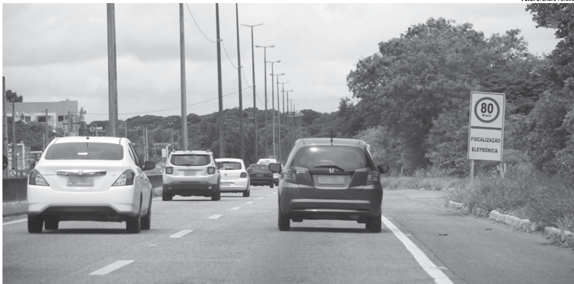
O limite de velocidade nas rodovias federais na Paraíba será observado com maior insistência pela PRF; atuação semelhante fará o Batalhão de Policiamento de Trânsito nas vias estaduais

Santa da PRF visa, além da diminuição no número de acidentes letais, garantir segurança e fluidez do trânsito aos usuários das rodovias federais. As fiscalizações serão intensificadas para combater o excesso de velocidade, a alcoolemia ao volante, o uso inadequado do cinto de segurança e às ultrapassagens