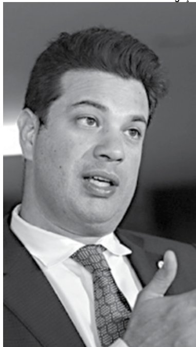
Ministro Leonardo Picciani, do Esporte