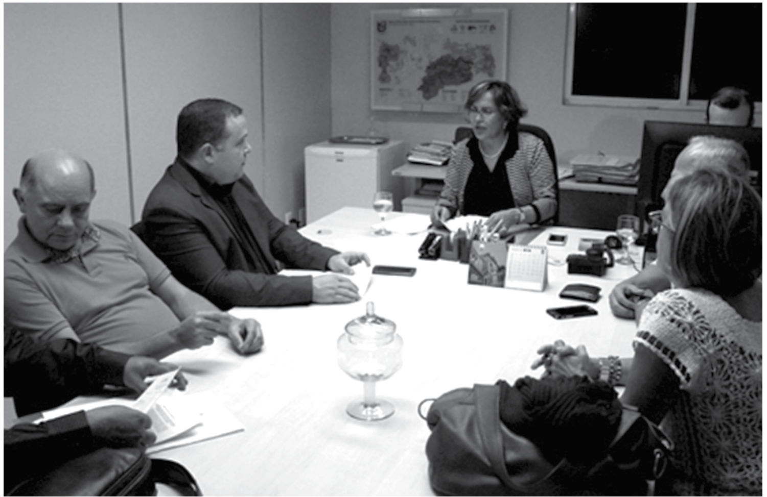
Para a promotora, as ações de desinstitucionalização não podem se converter em solução de continuidade do serviço de atenção à Saúde Mental

A promotora destaca ainda que as ações de desinstitucionalização não podem se converter em solução de continuidade do serviço de atenção à Saúde Mental, com a consequente desassistência a pacientes. “As decisões tomadas no âmbito da gestão