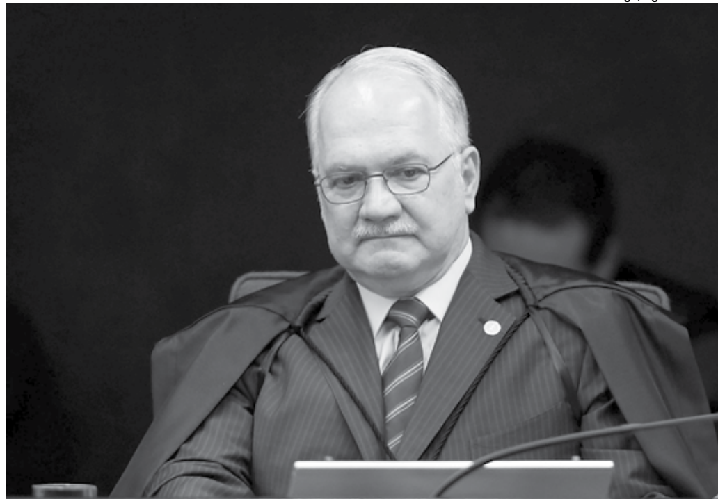
Ministro Edson Fachin pediu providências ao Supremo Tribunal Federal contra as ameaças que vem recebendo