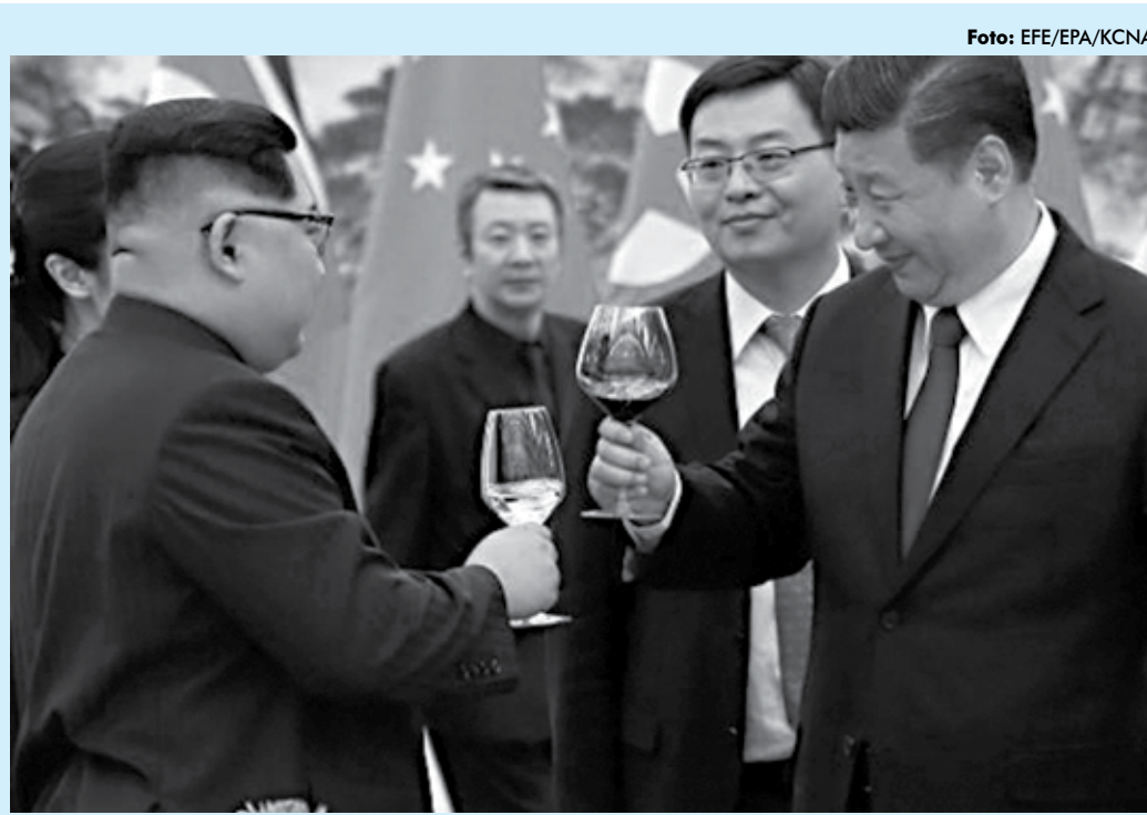
Presidentes Kim Jong-un e Xi Jinping brindam durante encontro secreto realizado na capital chinesa

O ministro das Relações Exteriores da Rússia, Sergei Lavrov, acusou os EUA de “pressão” e “chantagem” sobre os países ocidentais para que aceitassem expulsar diplomatas russos em represália pelo envenenamento do ex-espião Sergei Skripal e sua filha Yulia, do qual autoridades do Reino Unido responsabiliza a Rússia.