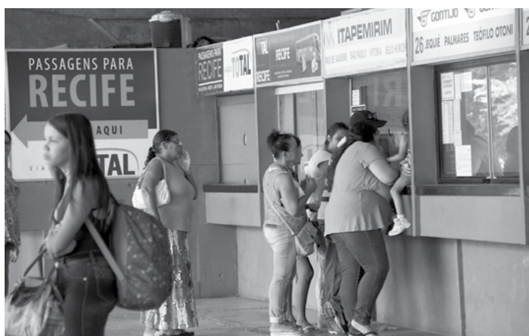
Expectativa da administração do Terminal Rodoviário da capital é de um aumento de 5% no fluxo de passageiros

Divisão de Fiscalização do órgão ambiental atuará normalmente na Semana Santa com equipe de plantão atendendo demandas feitas por telefone